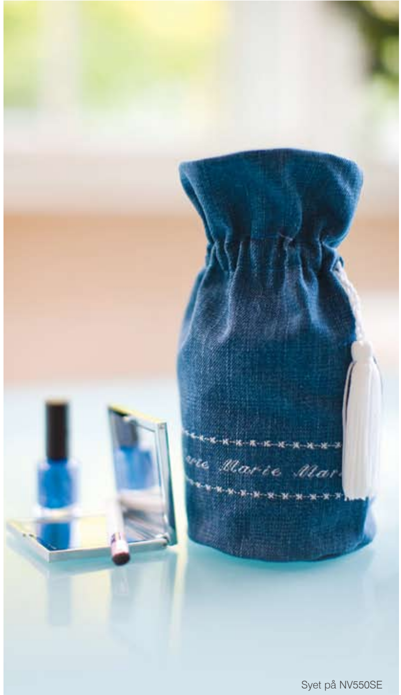
Syet på NV550SE